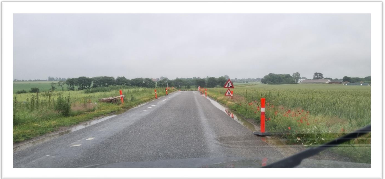
Figur 1 Abelonelundvej - Skolevej 2-i-1 – vil du have dit barn til at cykle her?

Strib er igennem en årrække vokset og nye boligområder er kommet til og flere er planlagt. I en pendlerby som Strib giver det en voldsom forøgelse af trafikken til/fra Strib på daglig basis – der er nævnt 2000+ biler i tillæg til nuværende. Dette giver en forøget belastning af vejnettet såvel under opførelse (med store køretøjer) som efterfølgende. Belastningen vil kunne mærkes – og mærkes allerede - i områder af Strib, på Strib Landevej, i Vejlbj, i Røjle m.fl. – og flere af vejene er skoleveje.