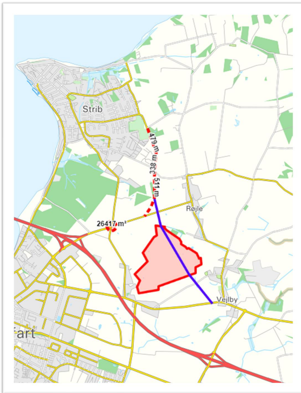
Figur 4 Kort med linjeføring af planlagt omfartsvej, ønske til forlængelse og solcellepark-område.

I Strib Lokaludvalg og Røjlehalvøens Lokaludvalg er vi ikke i tvivl. Vi skal agere nu for at vi ikke ender med et trafikkaos på veje, der er for smalle til at håndtere en stigende trafikmængde, en stigning i trafikken gennem eksempelvis vores landsbyer Røjle og Vejlbj, en stigning i trafikken på vores skoleveje m.v. Ift. skoleveje og stier arbejdes der sideløbende på at få lavet en grussti langs Abelonelundvej, som vi også ønsker at presse på for at få etableret hurtigst muligt.